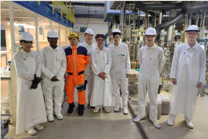
Les élèves à l'atelier