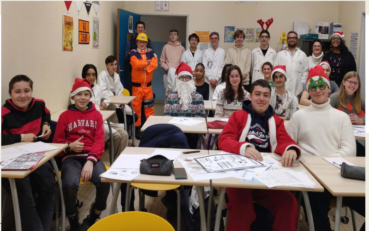
Tous les élèves et les professeurs ayant participé à cette semaine de production

A l'atelier, les élèves, accompagnés de Monsieur Goutier et de Madame Breemeersh, notre nouvelle professeure de Génie chimique, ont dû produire : De la bière pour les Premières, de l'eau distillée et des produits qui vont servir à créer un engrais pour les Secondes. L'eau distillée produite sera ensuite vendue lors d'occasions telle que la journée Portes ouvertes du lycée Galilée et revenir à la section professionnelle.