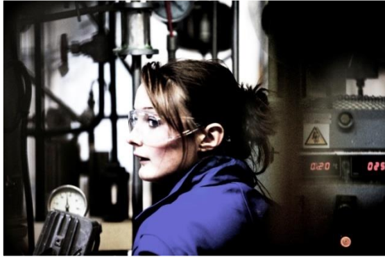
Élèves travaillant à l'atelier de génie chimique